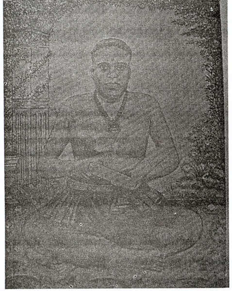
ஆரம்ப காலத்தில் பிரபல்யமாகிய நாவலரது வரையப்பட்ட ஒலியம்.