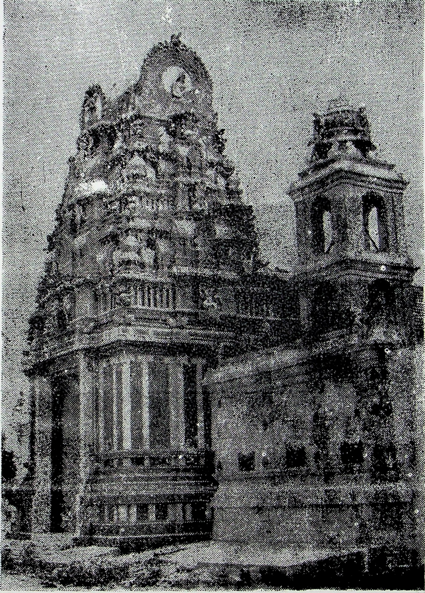
பரமேஸ்வரன் ஆலய முகப்புத் தோற்றம்